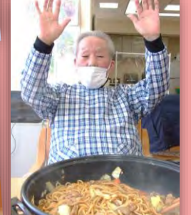
男性ご利用者が腕を振るって下さいました！ホットプレートへ野菜、豚肉を豪快に入れられ、丁寧に炒めて下さいました☆