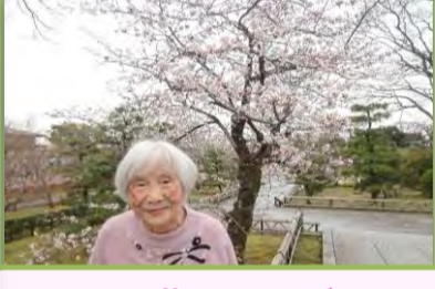
～お花見ドライブ～ 智積院(東山区)へ行きました♪