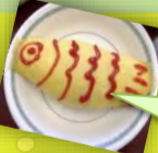
5月5日の昼食はオムライスでした♪