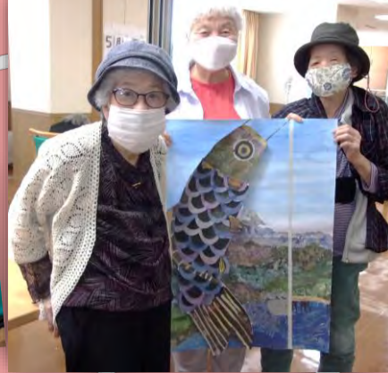
鯉のぼりの「頭」「ひれ」や、背景の「富士山麓」「湖」は新聞紙を使用したちぎり絵です。「うろこ」は新聞紙で型を取り、色を塗って頂きました♪