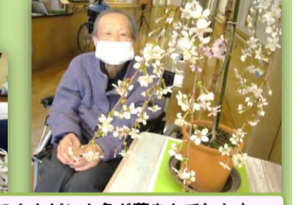
桜の盆栽 ほのかなピンク色が華やかでした♪