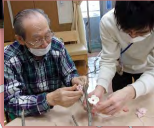
桜をかぎ針で編まれたり、枝に取り付けられる工程は、手指や腕の運動にも繋がりました☆